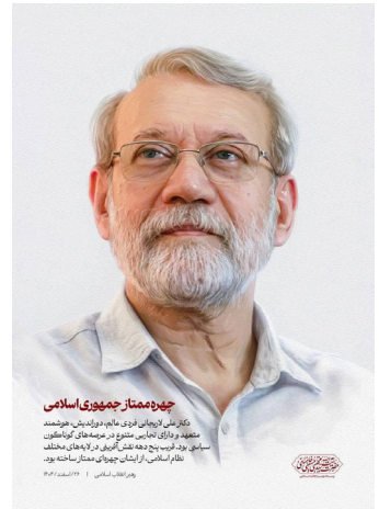
چهره ممتاز جمهوری اسلامی دکتر علی ایزدیان فردی عالم، دولتمد، هوشمند و دارای تجاربی متنوع در عرصه‌های امنیتی سیاسی، نظامی، فرهنگی و اقتصادی مختلف نظام اسلامی از ایشان چهره ممتاز ساخته بود. چهره ممتاز سال ۱۴۰۴

چهره ممتاز جمهوری اسلامی ایشان فردی عالم، دوراندیش، هوشمند، متعهد و دارای تجاربی متنوع در عرصه‌های گوناگون سیاسی، نظامی، امنیتی، فرهنگی و