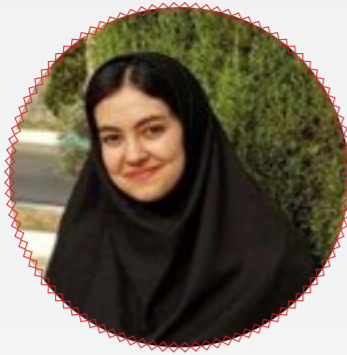
منا ویسی کارشناسی ادبیات فارسی